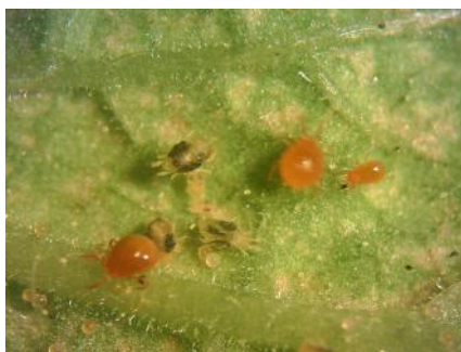
شکل ۲- رنگ نارنجی بدن و تفاوت اندازه کنه ماده با نر شکارگر Phytoseiulus persimilis در کنار کنه تارتین دونقطه‌ای