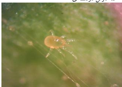
شکل ۴- مرحله لاروی کنه شکارگر Phytoseiulus persimilis با سه جفت پا و تغذیه شده از کنه تارتین