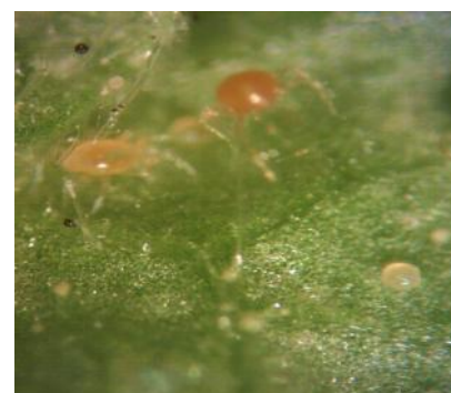
شکل ۵- مرحله پروتونمف کنه شکارگر Phytoseiulus persimilis