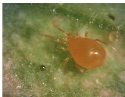
شکل ۱- رنگ نارنجی بدن کنه ماده بالغ شکارگر از کنه تارتین دونقطه‌ای Phytoseiulus persimilis