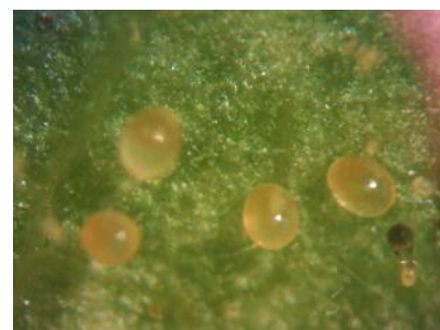
شکل ۳- جمعیت تخم به شکل بیضوی کنه شکارگر Phytoseiulus persimilis