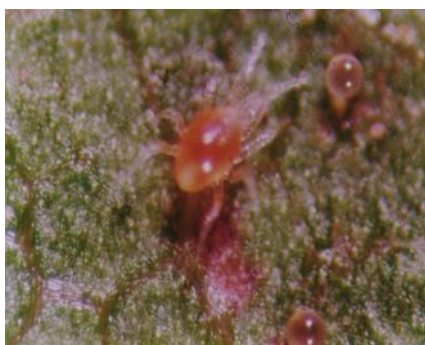
شکل ۶- مرحله دئوتونمف و نزدیک به تفریح تخم کنه شکارگر Phytoseiulus persimilis