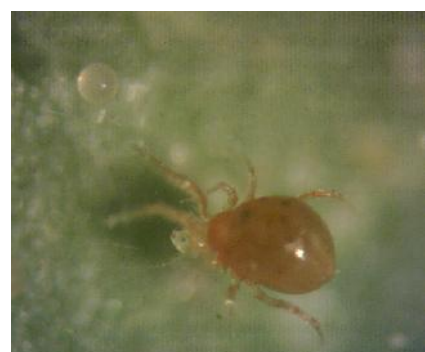
شکل ۸- رنگ بدن قهوه‌ای کنه ماده شکارگر Phytoseiulus persimilis و تغذیه شده از کنه تارتین دونقطه‌ای رز گلخانه‌ای