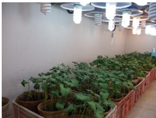
شکل‌های ۹ و ۱۰- نحوه کاشت بوته های لویا، تکثیر جمعیت کنه های تارتن و پرورش کنه شکارگر Phytoseiulus persimilis در اتاق رشد کنترل شده

بیش از ۱۰ کنه فعال در سطح زیرین بیش از ۵۰ درصد نمونه برگ‌ها) ضمن آنکه باعث خسارت کمی و کیفی کنه تارتن روی میزبان هدف خواهد شد، باعث افزایش هزینه مراقبت و طولانی شدن دوره کنترل بیولوژیک می‌شود. برای حفظ و تداوم جمعیت کنه شکارگر احتمالاً تا چندین نوبت نیاز به رهاسازی مجدد بخصوص در گلخانه خواهد بود.