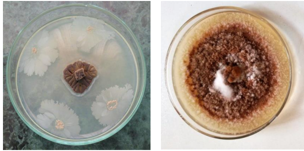
شکل ۱- تشکیل هاله بازدارندگی از رشد پرگنه قارچ C. pseudonaviculata در حضور جدایه B. subtilis FRBS10 در محیط PDA (چپ)، پرگنه قارچ در تیمار شاهد (راست)