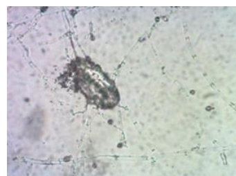
شکل ۲- تخم کلنیزه شده نماتد Meloidogyne javanica توسط Trichoderma crassum

طبق بررسی‌های انجام شده و مشاهده تخم‌ها زیر میکروسکوپ، پس از گذشت یک هفته، تمامی تخم‌های M. javanica توسط تمامی جدایه‌های قارچی مورد مطالعه، کلنیزه شدند (شکل ۲).