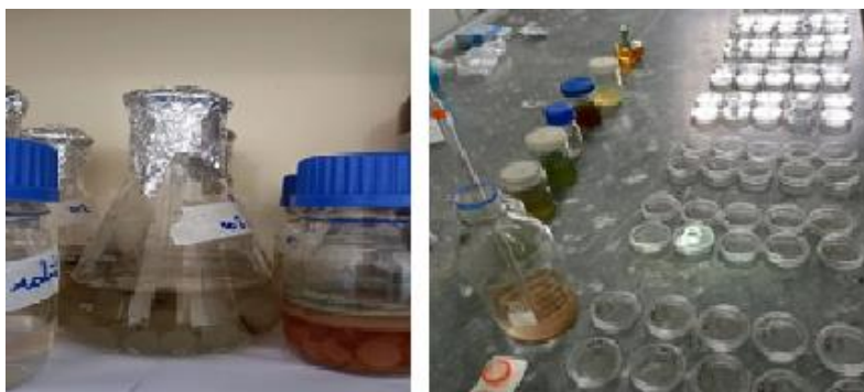
شکل ۱- کشت قارچ تریکودرما در محیط PDB (محیط کشت مایع) و بررسی تأثیر عصاره قارچ‌ها و گوگرد روی مرگ و میر لاروهای سن دو Meloidogyne javanica

۱۴ روز در دمای 25 \pm 2 درجه سلسیوس در محیط انکوباتور شیکردار نگهداری شدند، سپس محیط کشت مایع PDB حاوی توده‌های رشد کرده قارچ، از کاغذ صافی Whatman شماره یک سترون عبور داده شد، تا عصاره کشت قارچ با غلظت پایه به دست آید. سپس با افزودن میزان لازم آب مقطر استریل به غلظت پایه، 0/01 و 0/01 از عصاره کشت تهیه شد، از آب مقطر استریل هم به عنوان شاهد استفاده گردید. غلظت‌های مختلف عصاره قارچ‌ها و آب مقطر داخل پتری‌های استریل منتقل و به هر یک 25 \pm 300 عدد لارو سن دو نماتد اضافه گردید. برای بررسی اثر گوگرد با توجه به ماده موثره ترکیب (کود آلی سه کاره شرکت راسکود) 0/025 گرم گوگرد وزن شده، سپس با آب مقطر استریل به حجم 1000 میلی‌لیتر رسانده شد و برای هر تیمار حاوی گوگرد یک میلی‌لیتر اضافه شد. بعد از ۲۴، ۴۸ و ۷۲ ساعت درصد مرگ و میر لارو سن دو نماتد بررسی شد. آزمایش به صورت فاکتوریل و در قالب طرح کاملاً تصادفی و با پنج تکرار انجام شد (شکل ۱).